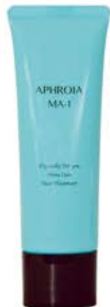
アフロイア MA-1 トリートメント ハリコシさらさらタイプ 50g ¥3,300(税込) 特許1出願中